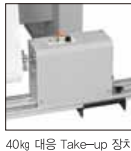
40kg 대응 Take-up 장치