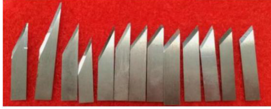
네덜란드 Ammerala Beltech 필드